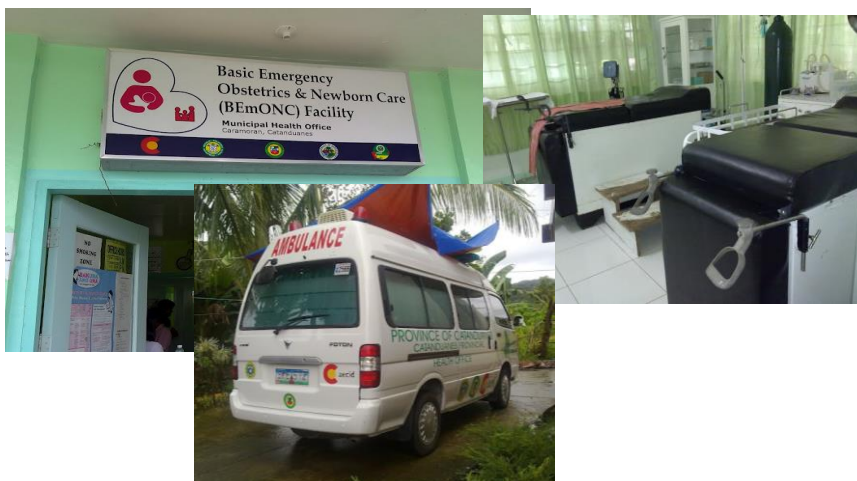
Arriba: Unidad de Obstetricia y Recién Nacidos en Catanduanes (Región V, Bicol)